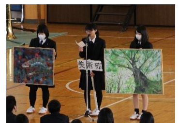
美術部の活動紹介